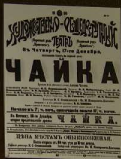
Афиша спектакля «Чайка» А.П. Чехова. 1908 Режиссеры: К.С. Станиславский, В.И. Немирович-Данченко

1899 – Лев Толстой закончил работу над романом "Воскресение"