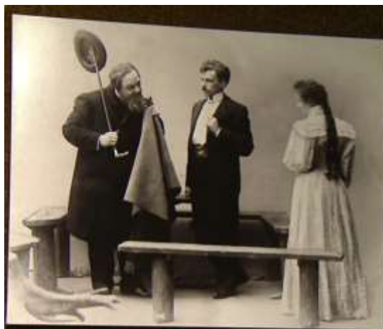
«Чайка» А.П. Чехова. 1908 Режиссеры: К.С. Станиславский, В.И. Немирович-Данченко Музыка: М.И. Глинка Сценарий: М.И. Глинка Трансформация: М.И. Глинка Иллюстрация: М.И. Глинка

1898 – Первая постановка драмы А. П. Чехова "Чайка" в Московском Художественном театре